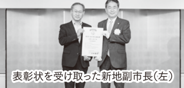
表彰状を受け取った新地副市長(左)

支援大賞」というアワードを通して子育てに良い商品、サービスがたくさん生まれてくることを支援しています。