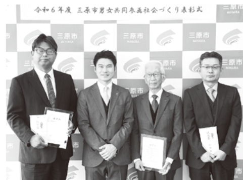
令和6年度は、株式会社本郷給食センター、社会福祉法人三原福祉会 三原慶雲寮が表彰されました！

○応募方法 10月3日(金)までに、応募用紙(人権推進課・市ホームページに用意)を人権推進課へ持参・郵送・FAX・電子メールで送付