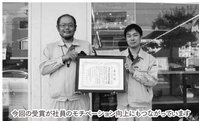
今回の受賞が社員のモチベーション向上にもつながっています

いずれも海洋生態系の維持とSDGs等の環境保全の観点から、法改正で検査が義務化されました。それに着目しいち早く新事業として展開したものになります。当社は非破壊検査業務で日常から船舶の所有者や管理会社と付き合いがあり、ワンストップでこの検査業務も受け持つことができるため、この点が強みとしてお客様と長いお付き合いをさせていただくことができます。