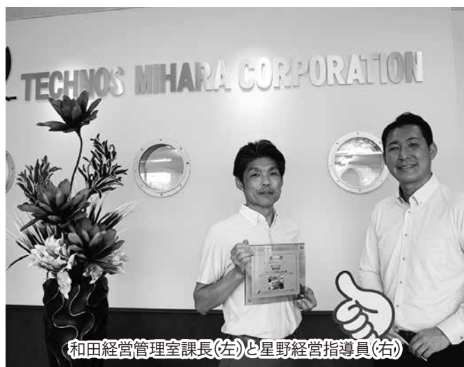
和田経営管理室課長(左)と星野経営指導員(右)

そのためには、日々精進を怠らず、社員にもお客様にも社会にも必要とされる企業に成長していかなければと思っています。