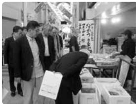
▲黄金商店街の説明を聞いた後現地を見学