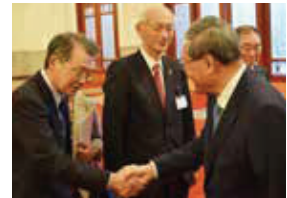
中国・李強首相（右）と握手する小林会頭

李強首相は、大規模な訪中団に歓迎の意を示すとともに、より緊密な二国間関係の構築、経済貿易関係のさらなる緊密化、ビジネス環境のさらなる最適化について言及した。