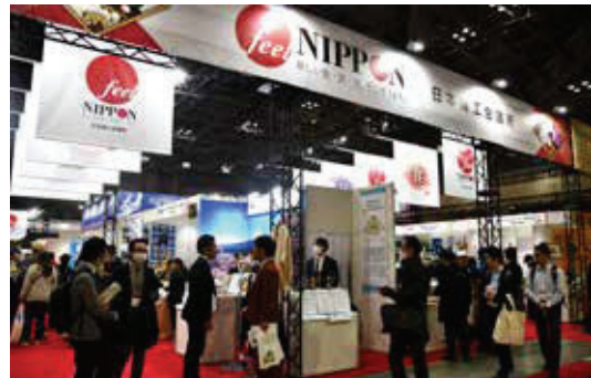
多くのバイヤーが訪れた商工会議所ブース

上大阪）、尼崎（兵庫）、大和高田（奈良）、米子・境港（鳥取）、岡山（岡山）、福山、府中（以上広島）、柳川、苅田（以上福岡）、伊万里、有田（以上佐賀）、津久見（大分）、日南（宮崎）、沖縄、浦添（以上沖縄）。中国の輸入禁止措置の影響を受ける国内水産物の販路開拓支援のための特設ブースには、土浦、三浦、米子・境港、津久見の商工会議所が出展し、地域の水産品・水産加工品をアピールした。期間中の商談件数は1265件、見積もり依頼件数943件。会期中の成約は18件、継続案件も1163件に上った。